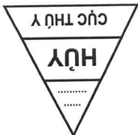
Hình 7: Mẫu dấu hủy đối với gia súc