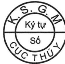
Hình 2. Mẫu dấu kiểm soát giết mổ gia cầm để xuất khẩu