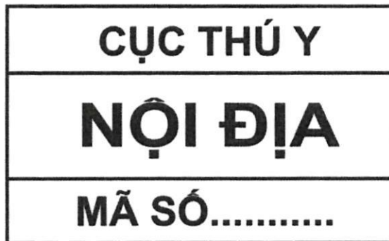
Hình 3. Mẫu dấu kiểm soát giết mổ gia súc để tiêu thụ nội địa