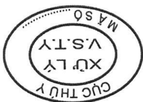
Hình 5: Mẫu dấu xử lý vệ sinh thú y đối với gia súc