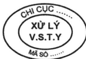
Hình 12: Mẫu dấu xử lý vệ sinh thú y đối với gia cầm