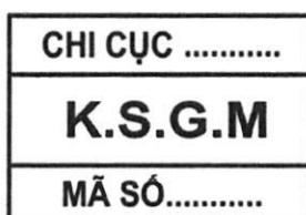
Hình 10: Mẫu dấu kiểm soát giết mổ gia cầm