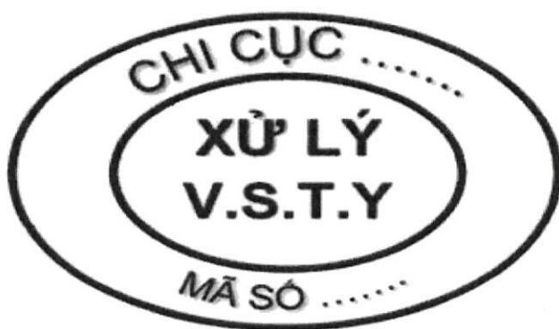
Hình 11: Mẫu dấu xử lý vệ sinh thú y đối với gia súc