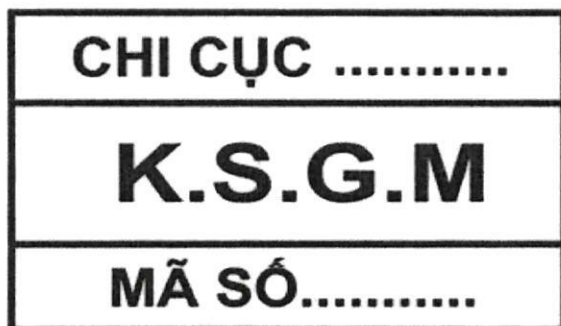
Hình 9: Mẫu dấu kiểm soát giết mổ gia súc