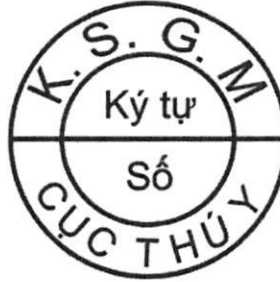
Hình 1. Mẫu dấu kiểm soát giết mổ gia súc để xuất khẩu